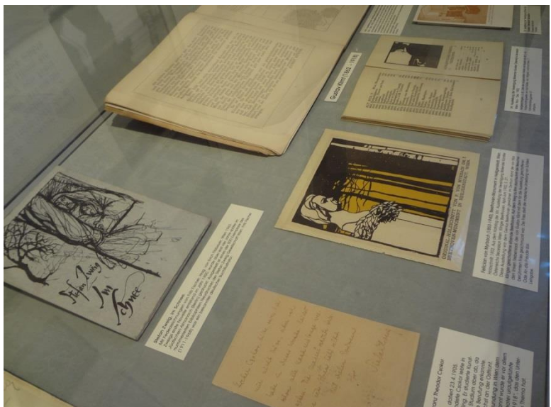
Vitrine für Stefan Zweig